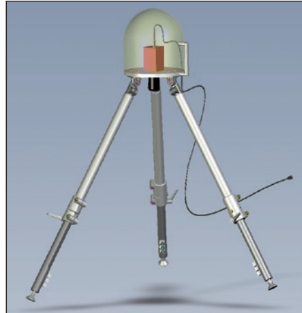
Mobiles Sfs-Messsystem mit 200 × 200 mm 2 Messfeld. Die wesentlichen Elemente sind die Kamera im Kopf und die LED-Gruppen an den unteren Enden der Stativbeine

Flachere Strukturen bis unter 10 µm Tiefe sind bei entsprechend flachen Beleuchtungswinkeln gut zu vermessen. Bei der Überprüfung großer Flächen zählt